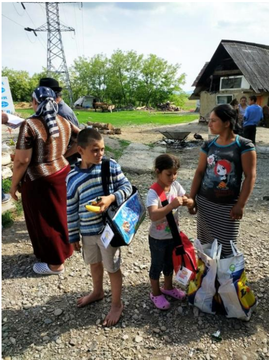
Een indrukwekkende dag.